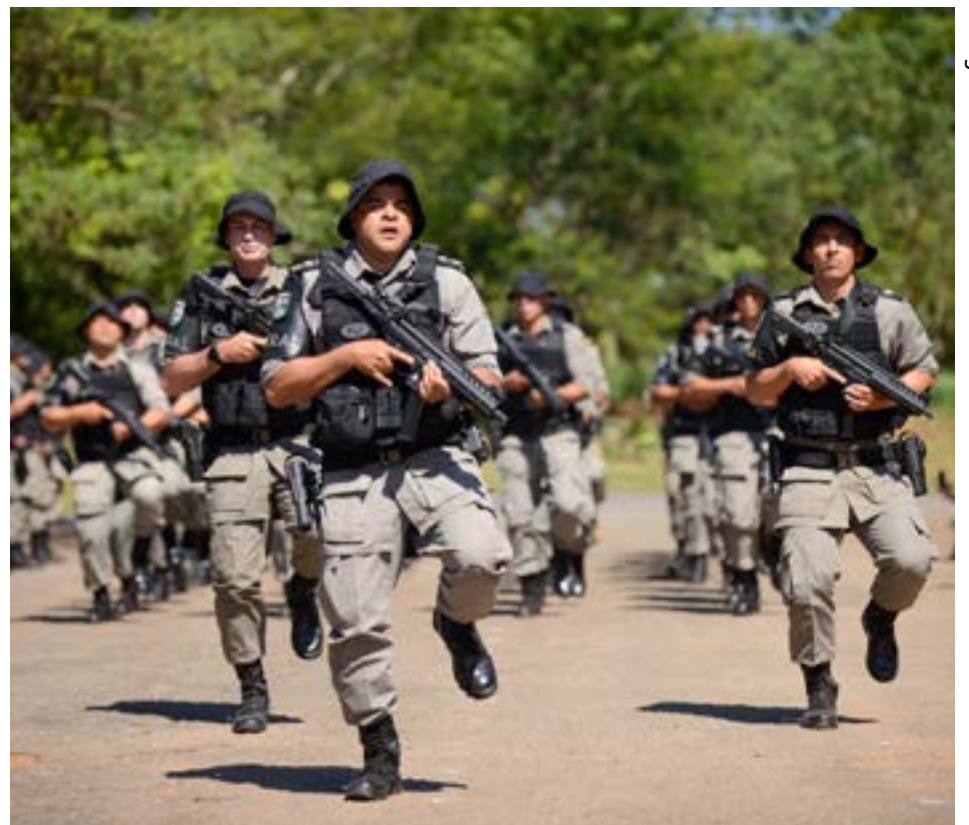
Novos investimentos e integração entre as forças policiais resultam em queda no número de homicídios