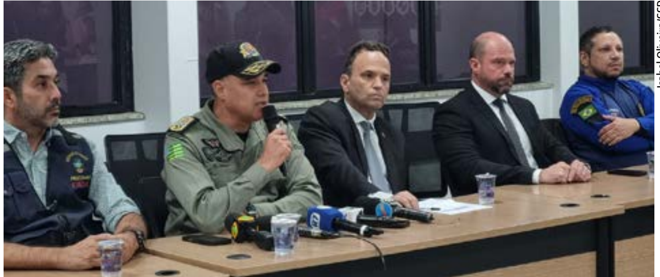
Representantes das forças de segurança de Goiás detalham ações contra pessoas que teriam promovido foguetório em “homenagem” a bandidos

Ao detalhar que a operação se estendeu por diferentes municípios, sendo 14 prisões regis-