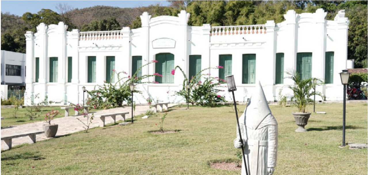
Palácio da Instrução, na cidade de Goiás: estado vai investir R$ 1,7 milhão para reforma geral do prédio histórico

referência dos goianos, que é a boa educação”, afirmou o chefe do Executivo, durante solenidade de transferência simbólica dos Poderes, na última segunda-feira (22/7). Os serviços serão conduzidos pela Secretaria de Estado da Educação (Seduc), conforme critérios para conservação de prédios tombados. O Palácio da Instrução foi construído entre os anos de 1928 e 1929. Já funcionou como ins-