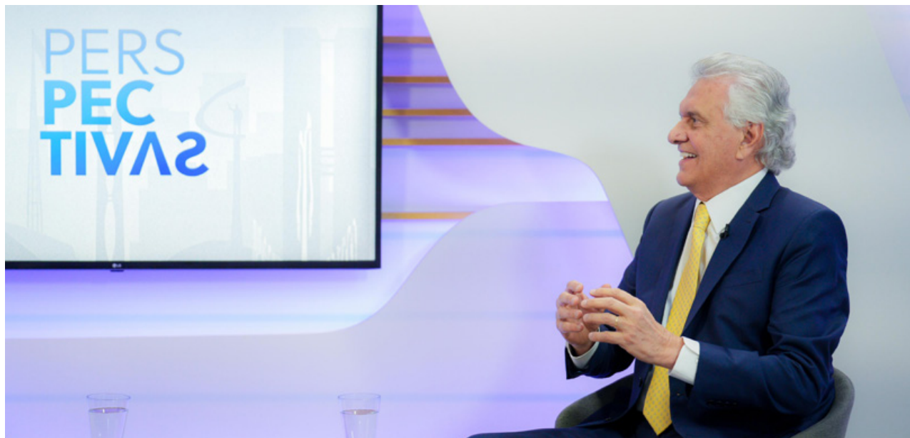
Ronaldo Caiado destacou, em entrevista no SBT News, que o trabalho de segurança pública de Goiás é referência nacional

vida dos estados, Caiado disse que o projeto está em fase embrionária. “Foi liberado um primeiro projeto, publicado pelo presidente do Senado, Rodrigo Pacheco. Está nas mãos do relator. Conversei com ele. Disse que será votado depois que os governadores se pronunciarem. Isto deve acontecer depois do recesso, a partir de agosto”, afirmou.