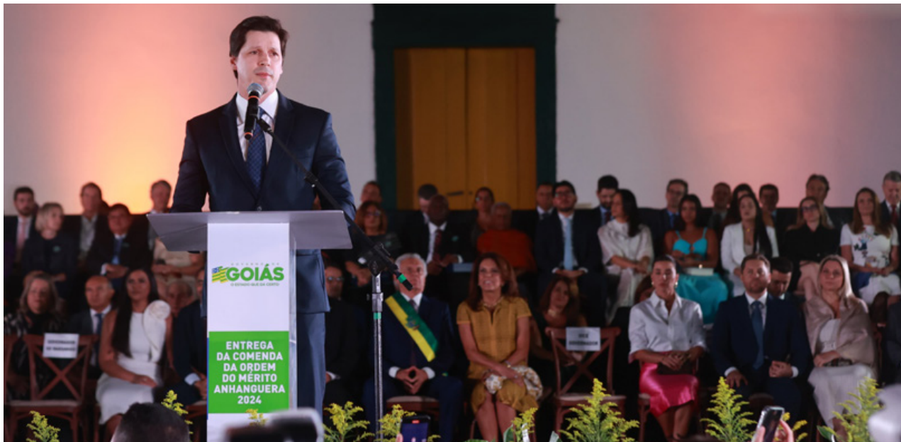
Daniel Vilela reconhece esforço e dedicação dos servidores públicos estaduais em agendas institucionais realizadas na cidade de Goiás

O vice-governador manteve o mesmo tom das declarações ao visitar a sede da Procuradoria-Geral do Estado (PGE) na Praça Dr. Tasso de Camargo, no Centro da antiga Vila Boa. “A