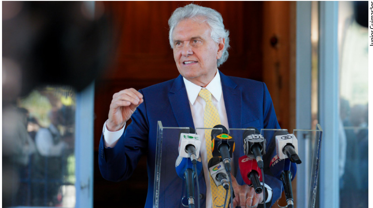
Caiado e o ministro Fernando Haddad em Brasília na semana passada: diálogo sobre o RRF e defesa de maior capacidade de investimento do estado

Durante a reunião, o governador destacou que o ministro reconheceu que Goiás está “fazendo a tarefa de casa” e afirmou que há a possibilidade de incluir o RRF no novo programa de renegociação