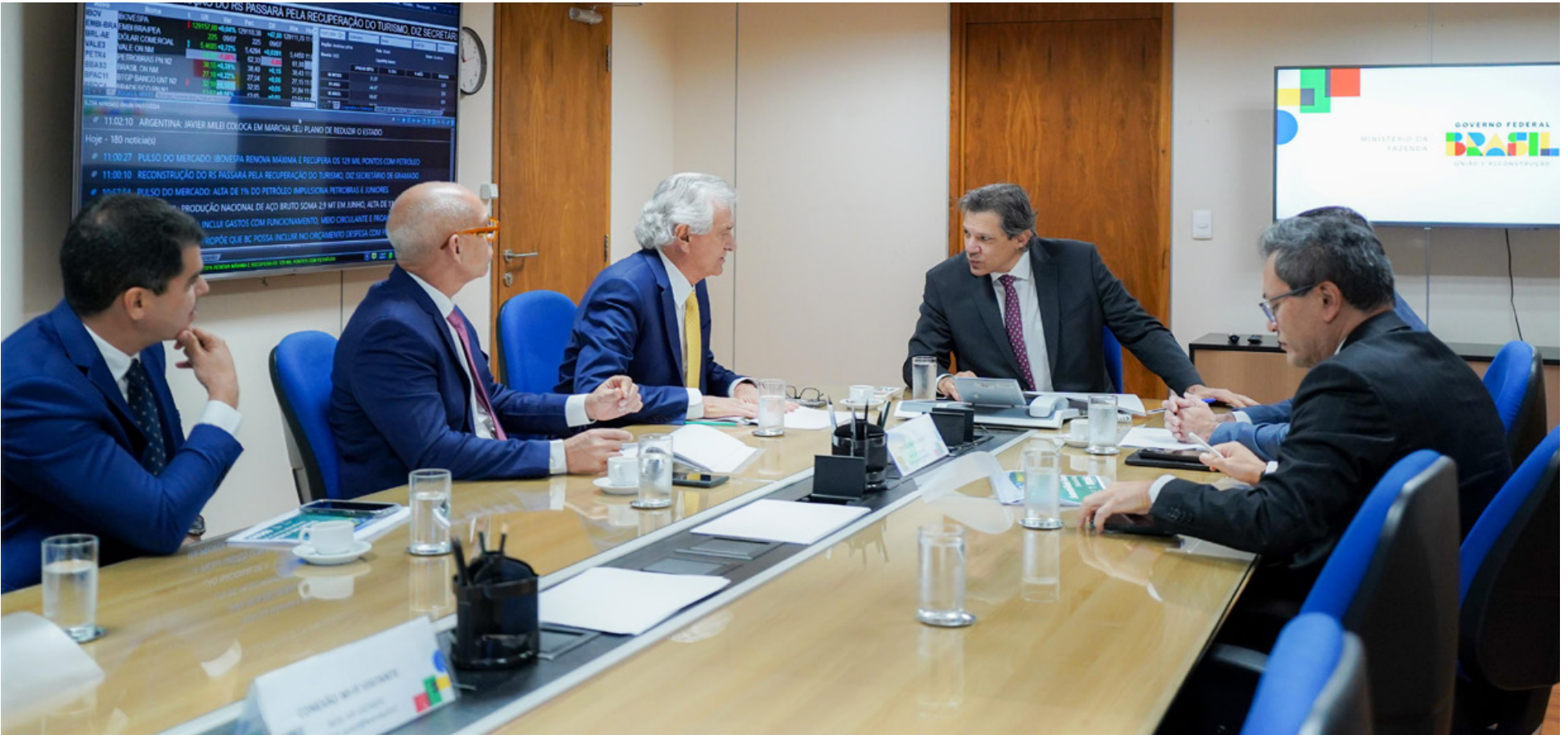
Procedimento está previsto nas regras do Regime de Recuperação Fiscal e ocorreu após encontro do governador Ronaldo Caiado com o ministro Fernando Haddad