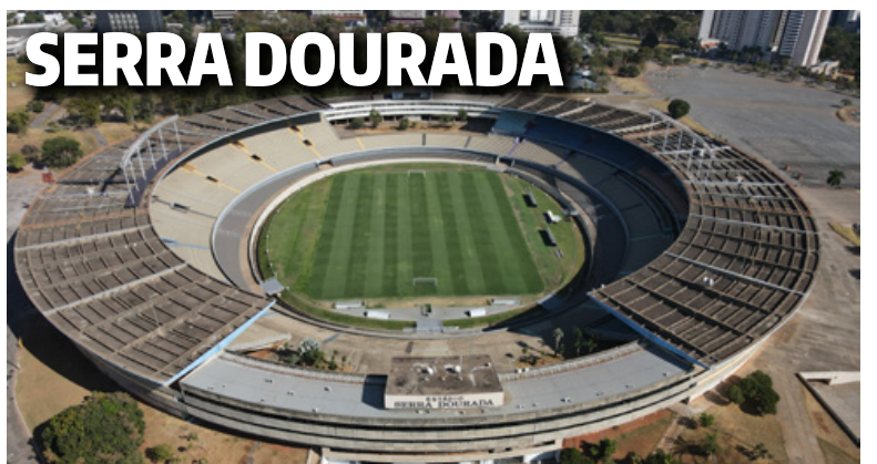
SERRA DOURADA Começa fabricação de estruturas metálicas para nova iluminação ESPORTE | 6