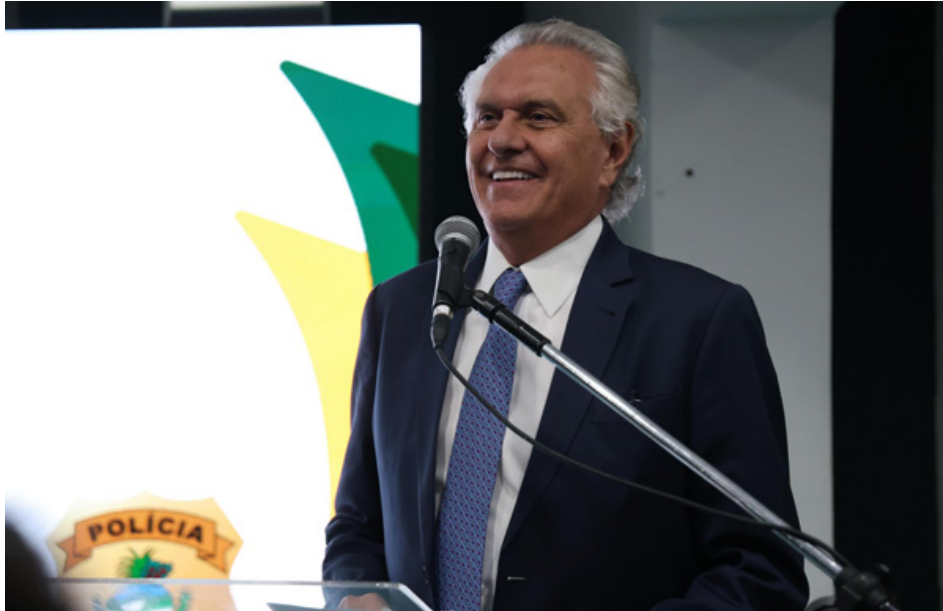
Queda dos índices de feminicídio é resultado do trabalho de integração das forças policiais

O governador Ronaldo Caiado ressaltou a importância da queda no número de feminicídio no estado. "O resultado positivo é fruto do trabalho integrado entre as forças de segurança e outros Poderes. O feminicídio é uma das nossas maiores preocupações no âmbito da segurança