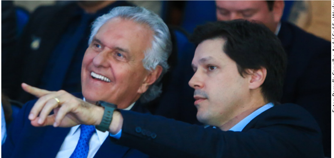
Daniel Vilela participa da apresentação do balanço das ações das Forças de Segurança do primeiro semestre de 2024

Durante seu discurso, Daniel Vilela ainda apontou o impacto a redução dos índices de criminalidade alcança na economia goiana. Segundo ele, Goiás tem atraído a atenção nacional e internacional, destacando-se como um lugar seguro