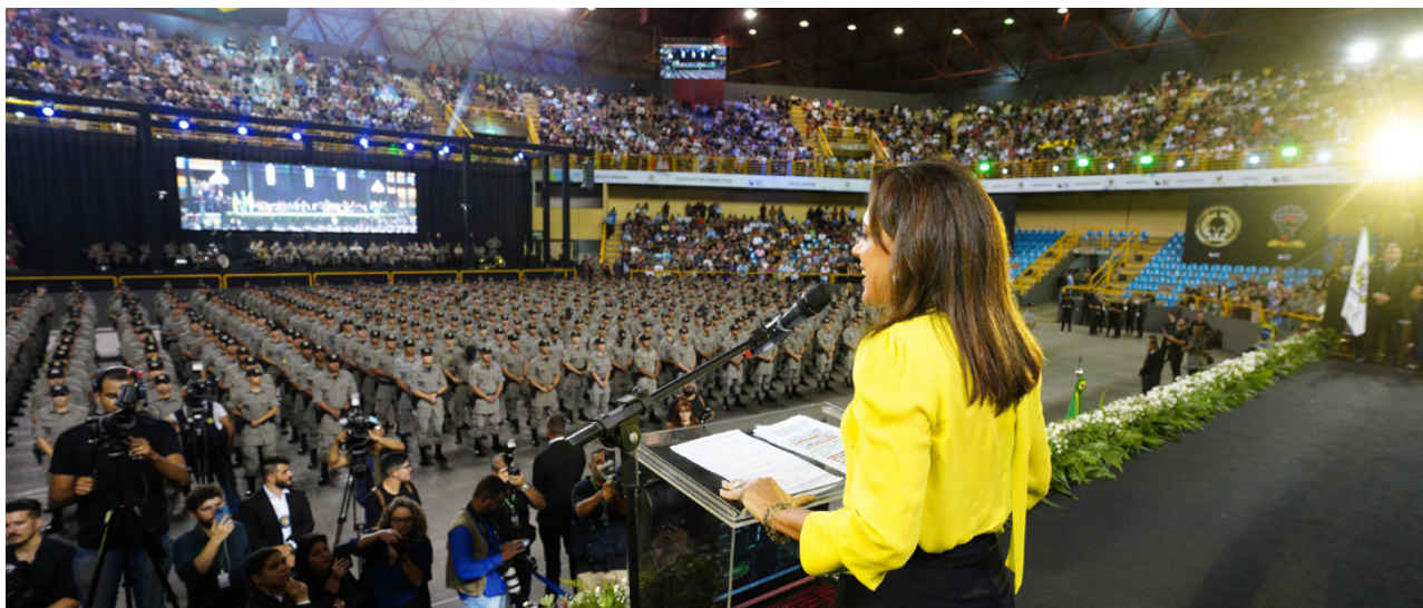
Primeira-dama representa o governador na solenidade de formatura dos novos PMs: “Com a vitória de vocês quem ganha é toda a sociedade”