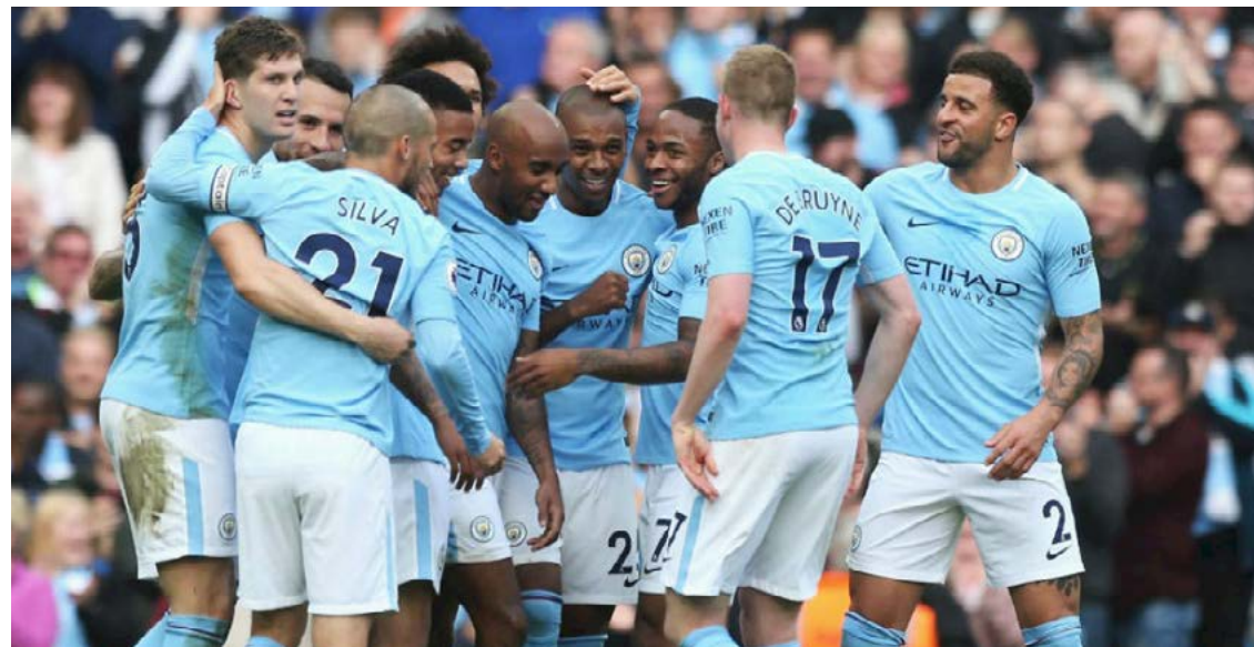
Manchester City FC

Conforme o balanço, o faturamento recorde supera em 21% o de 2015/16. Este crescimento, de acordo com as informações divulgadas, ocorreu muito em decorrência do aumento dos novos contratos de transmissão para o Campeonato Inglês. Outro fator que impulsionou a arrecadação foram os novos acordos comerciais do clube ao redor do mundo, que fizeram com que o