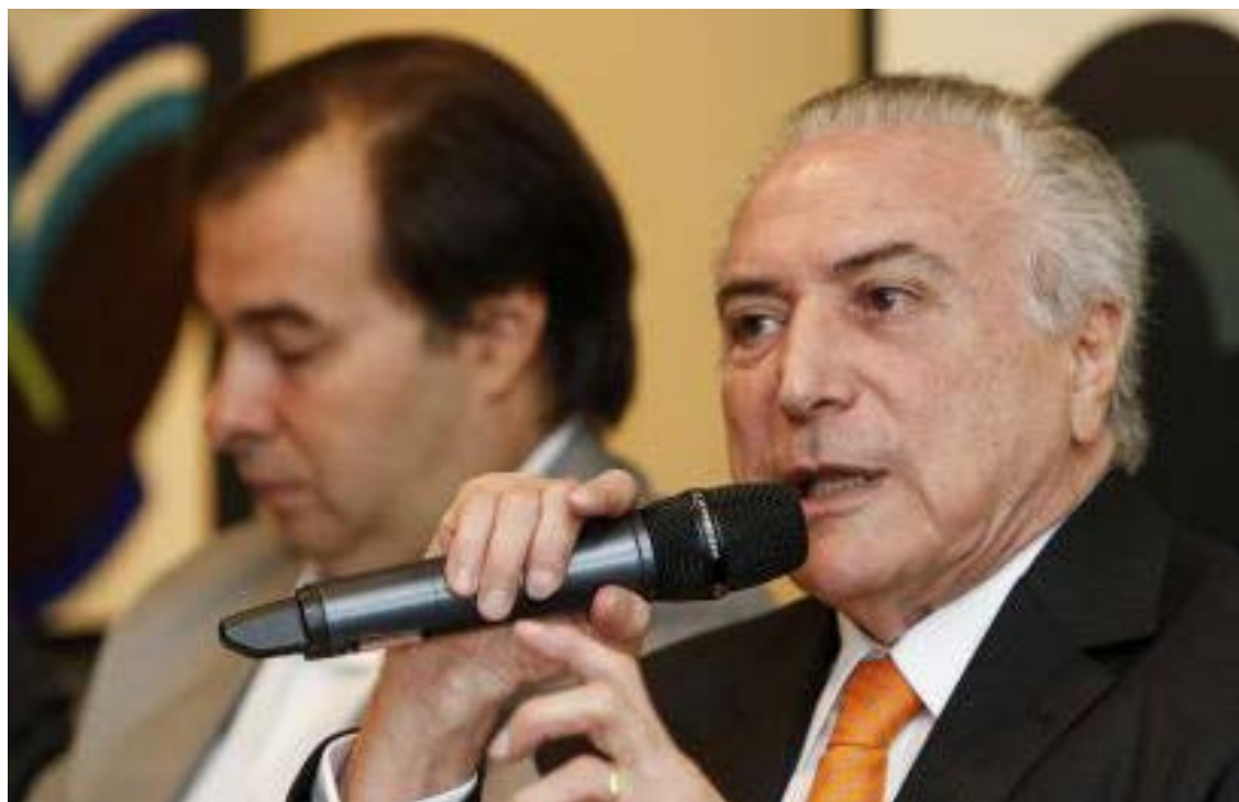
Presidente Michel Temer participa de reunião com o presidente da Câmara dos Deputados, Rodrigo Maia, e líderes partidários

Economia precisa ser feita, diz presidente da Câmara: "Eu acho que o que vai se propor vai ajudar na aprovação da reforma da Previdência. A gente não pode perder muito da economia que precisa ser feita para os próximos anos. Mas, ainda não há na articulação política a solução política para votação na Câmara. A gente sente que os líderes ainda estão com muita dificuldade de convencer