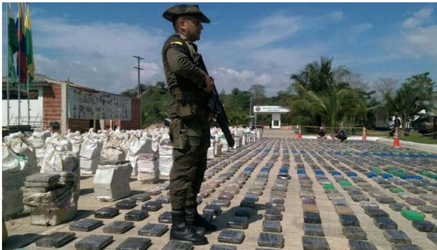
Governo da Colômbia

A Polícia Nacional da Colômbia apreendeu mais de 12 toneladas de cocaína da organização criminosa Clã del Golfo. Segundo o governo colombiano, o valor da apreensão é estimado em US$ 360 milhões, ao preço de mercado da droga nos Estados Unidos. Segundo as autoridades locais, 400 agentes antinarcóticos invadiram quatro imóveis nos municípios de