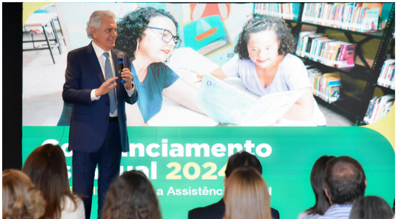
Governador Ronaldo Caiado anuncia R$ 14,9 milhões do Cofinanciamento Estadual para 113 municípios investirem em assistência social

entre R$ 72 mil e R$ 1,2 milhão. Para receber a verba, o município precisa ter investido pelo menos 70% dos recursos repassados pelo Cofinanciamento em 2023. “Esse recurso significa comida na mesa de quem mais precisa. É atendimento, dignidade e garantia de direitos. Fortalece o Sistema Único de Assistência Social (Suas)”, destacou Gracinha Caiado, que frisou a parceria entre Estado e prefeituras. Mesmo previsto na Constituição Federal e em Lei Estadual de 2015, este repasse só virou realidade e significou recurso para as prefeituras como uma política de Estado a partir da