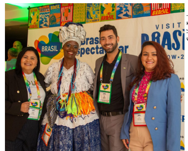
Goiás Turismo Governo de Goiás participa de missão internacional para atrair turistas estrangeiros

Nos eventos, são apresentadas as potencialidades que só Goiás oferece, como a maior estância hidrotermal do mundo, em Caldas Novas e Rio Quente; o maior comple-