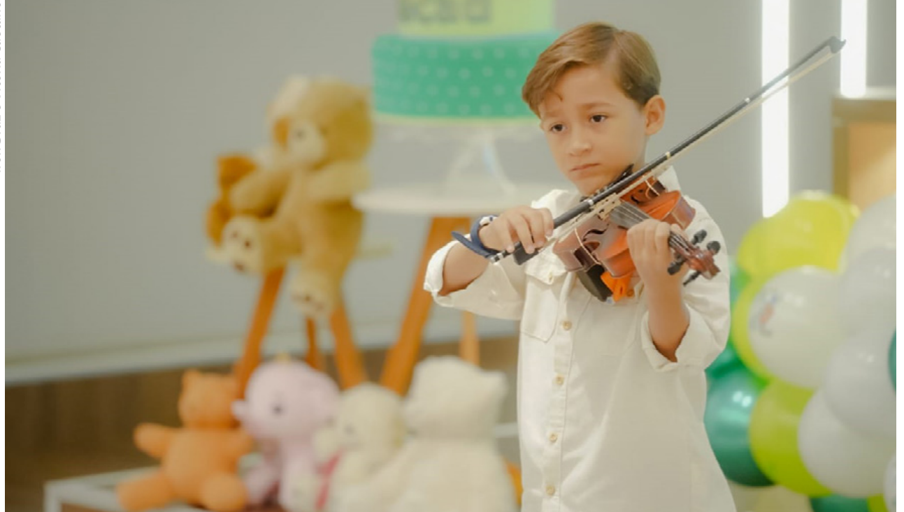
Exposição de telas pintadas pelos pacientes, oficinas de pintura facial e esculturas de balão marcam celebração dos dois anos do Hecad

A programação em comemoração ao aniversário da unidade contou com exposição de telas pintadas pelos pacientes, oficinas de pintura facial e esculturas de balão, além da distribuição de balões personalizados e cupcakes para os pacientes em internação. “Para além dos números, estamos construindo um legado marcado pela humanização. Temos muito orgulho em transformar o gerir e o cuidar para amparar de forma digna as crianças e adolescentes no momento em que elas mais precisam, cuidando da