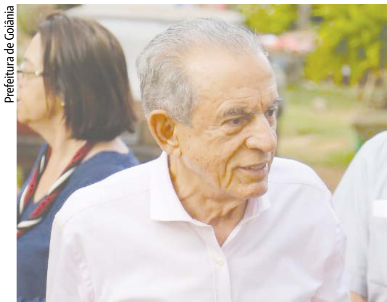
Prefeitura de Goiânia

Por 14 votos contra 9, a maioria do plenário manteve veto do prefeito Iris Rezende (PMDB) às emendas dos vereadores à Lei de Diretrizes Orçamentárias (LDO) para 2018. Ao todo, foram 38 emendas apresentadas pelos vereadores que foram retiradas da lei que dá as diretrizes para a elaboração da Lei Orçamentária Anual (LOA), atualmente em tramitação na Casa.