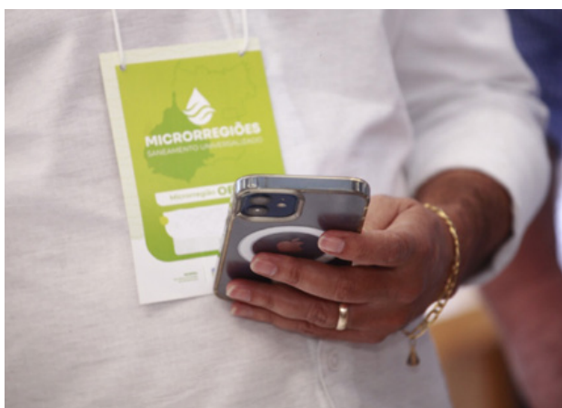
Representantes de estados e municípios se reúnem para discutir contratos de serviço de água tratada e esgotamento sanitário

As reuniões serão promovidas por videoconferência, com transmissão ao vivo pela YouTube oficial da Seinfra, sendo a primeira da MSB Oeste, às 10h;