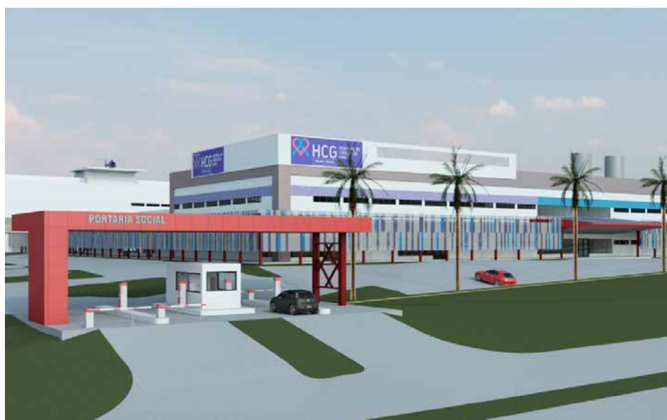
Projeto arquitetônico do novo Hospital do Câncer de Goiás na capital Goiânia

Ainda em Brasília, o governador Ronaldo Caiado esteve na Secretaria de Coordenação e Governança do Patrimônio da União (SPU), vinculada ao Ministério da Economia, para tratar sobre a concessão do terreno onde será construído o Hospital do Câncer de Goiás, em Goiânia.