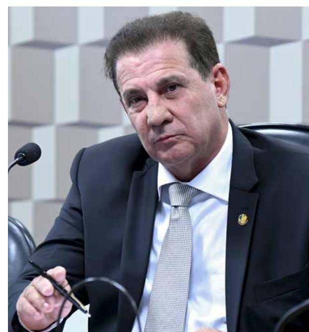
Vanderlan Cardoso é um dos líderes do movimento, dentro do Senado, pela aprovação da nova Lei de Improbidade

Ao todo, 37 senadores que respondem a ações penais e ou por improbidade – um deles chegou a ser condenado a 2 anos e 8 meses de prisão por peculato, mas a pena estava prescrita. O levantamento foi feito pelo jornal O Estado de S. Paulo nos Tribunais de Justiça dos Estados, na Justiça Federal, no Superior Tribunal de Justiça (STJ) e no Supremo Tribunal Federal (STF).