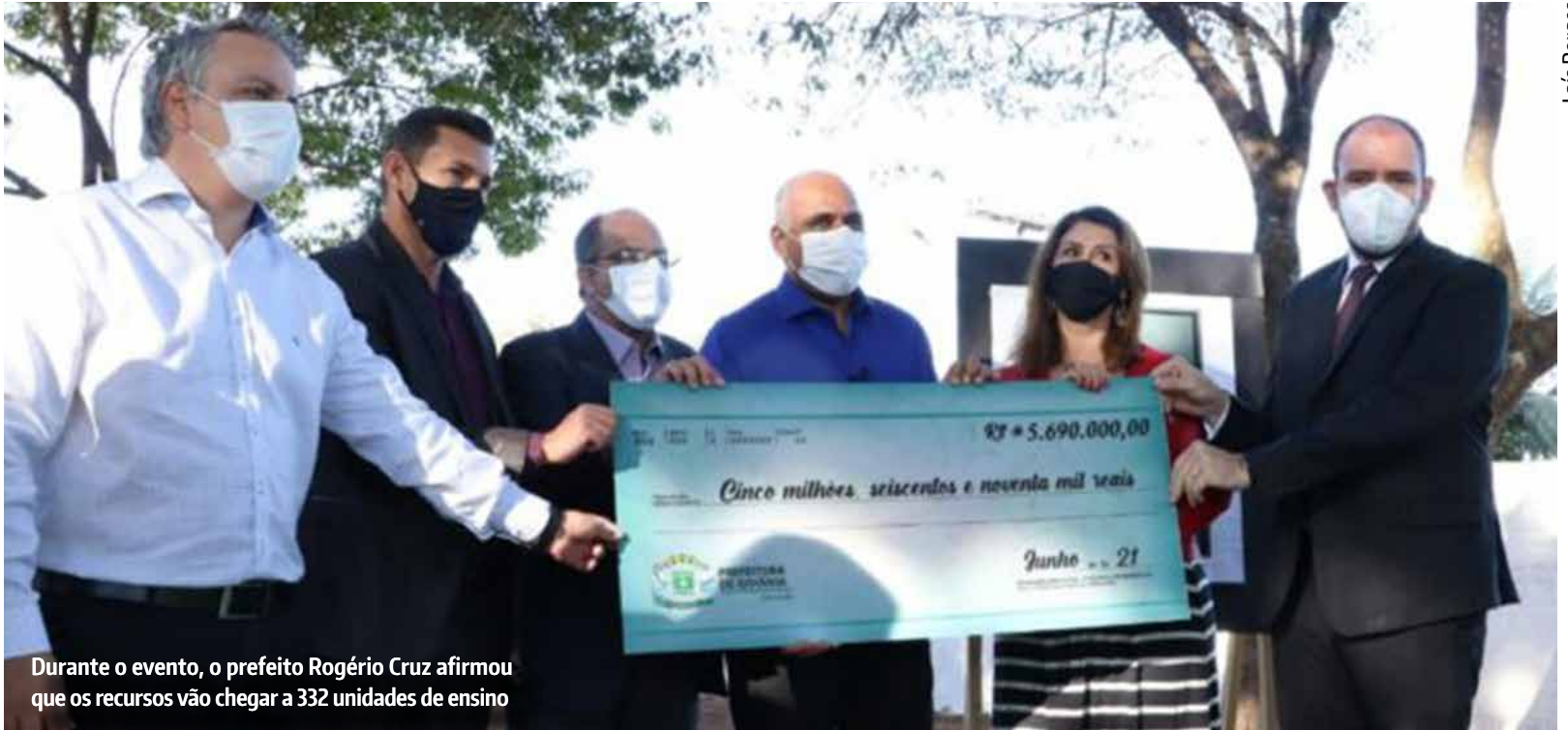
Durante o evento, o prefeito Rogério Cruz afirmou que os recursos vão chegar a 332 unidades de ensino

Desde o início de junho, a Prefeitura de Goiânia transfere recursos financeiros às instituições educacionais para a reforma e manutenção da rede física. Os recursos fazem parte do Escola Viva, programa municipal que prevê a modernização das unidades de ensino da capital. Nesta terça-feira (22/06), durante o evento que marcou a abertura de novas vagas na Escola Municipal de Tempo Integral Maria Genoveva, o prefeito Rogério Cruz e o secre-