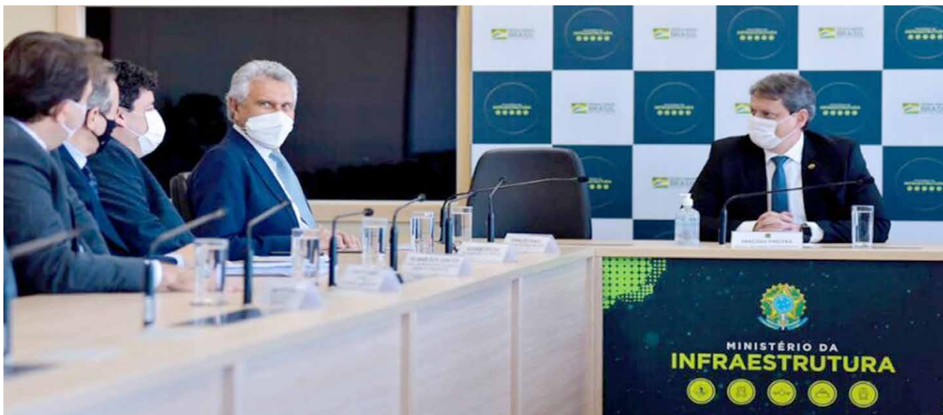
Ronaldo Caiado anuncia instalação, em Anápolis, do CETF, durante audiência com ministro da Infraestrutura, Tarcísio Gomes de Freitas, em Brasília: "Algo semelhante só existe nos Estados Unidos e vai atender toda demanda"

Durante audiência, nesta terça-feira (22/06), com ministro da Infraestrutura, Tarcísio Gomes de Freitas, em Brasília, governador confirma que Memorando de Entendimento para formalização do complexo será assinado dia 15 de julho