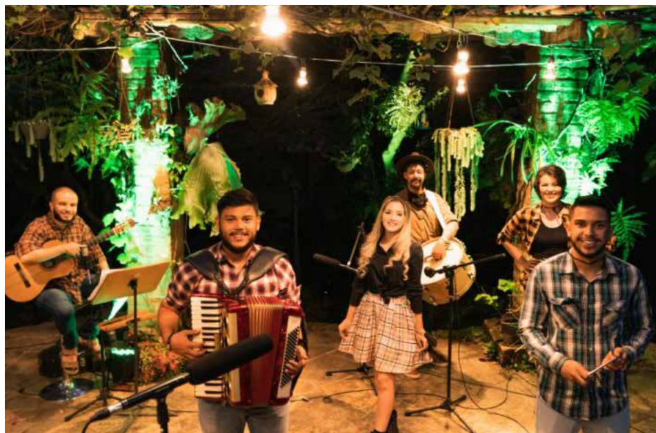
Canal da Orquestra Sinfônica no link: https://www.youtube.com/channel/UC-Hw4pTIU6YPfmGkJP5RXg

Executada pelo Coro Juvenil de Goiânia, com produção musical do maestro Edson Marques e direção artística de Wesley Neres, a live contará com a apresentação das músicas mais clássicas da cultura junina.