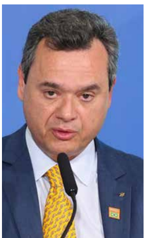
O presidente do Banco do Brasil, Fausto de Andrade Ribeiro, durante lançamento do Plano Safra 2021/22 no Palácio do Planalto