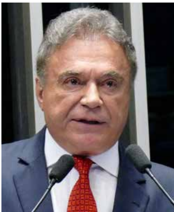
Senador Álvaro Dias, do Podemos: no máximo, a aprovação será postergada, mas dificilmente deixará de acontecer em algum momento

A expectativa de Álvaro Dias é que, a partir de agosto, as comissões permanentes do Senado voltem ao ritmo normal.