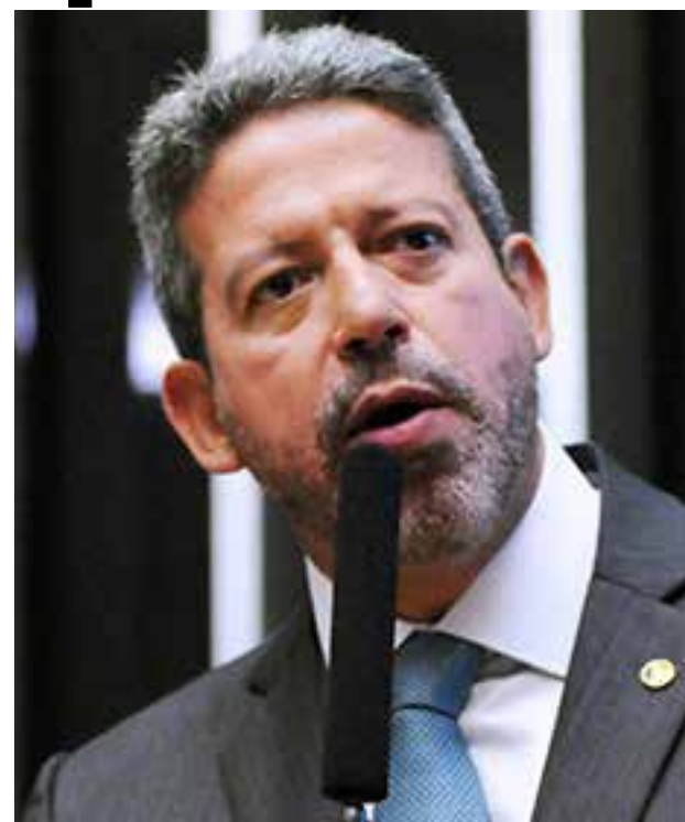
Presidente da Câmara dos Deputados, Arthur Lira comandou a aprovação da nova Lei de Improbidade, mesmo sendo ele mesmo réu em processos

“Acho difícil derrotar. Por isso, temos que tentar ganhar tempo para tentar, quem sabe, alterações no projeto. Isso vamos ver