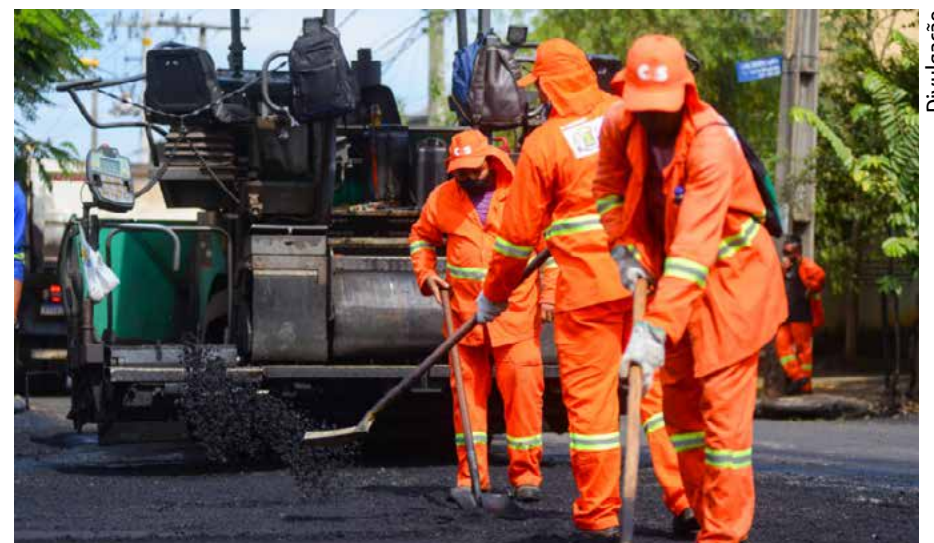
O serviço é realizado no Residencial Goiânia Viva, Setor Bueno, Jardim Aruanã, Recanto do Bosque e Setor Caravelas

A Prefeitura de Goiânia realiza o trabalho de reparo e manutenção asfáltica nos bairros de Goiânia, em média, seis dias por semana. Nesta quarta-feira (23/6), cinco equipes da Secretaria de Infraestrutura Urbana (Seinfra), com 33 servi-