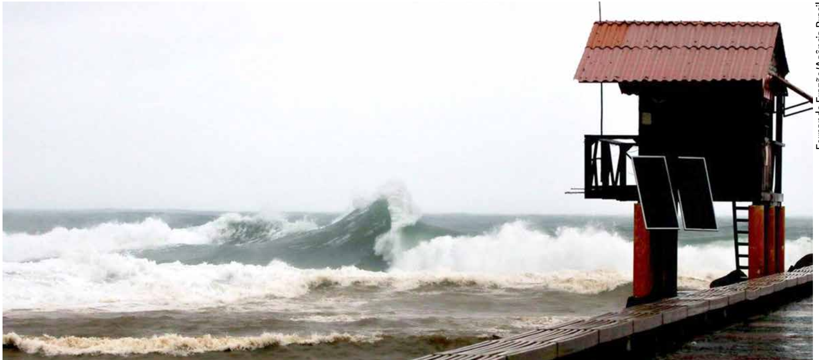
Um “perigo para as sociedades e para a economia mundial em geral”, alerta o IPCC, lembrando que cerca de 10% da população mundial e dos trabalhadores estão a menos de dez metros acima do nível do mar

da expansão dos oceanos e do degelo causado pelo aquecimento, a subida do nível do mar também ameaça contaminar os solos agrícolas com água salgada e engolir infraestruturas estratégicas, como portos ou aeroportos.