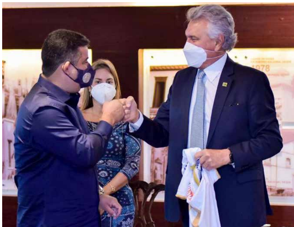
O governador Ronaldo Caiado durante lançamento da nova etapa do Programa Nota Fiscal Goiana e do Time Goiano do Coração: “Nada melhor àquele que veste a camisa do time, que vista também a camisa do Estado de Goiás”

Outra novidade apresentada durante o evento foi o lançamento do Time Goiano do Coração. Trata-se de um benefício financeiro aos times da primeira divisão do Campeonato Goiano de Futebol. “Nada melhor àquele que veste a camisa do time. Que vista também a camisa do Estado de Goiás”, frisou o governador Ronaldo Caiado. Na solenidade, ele recebeu camisas da Associação