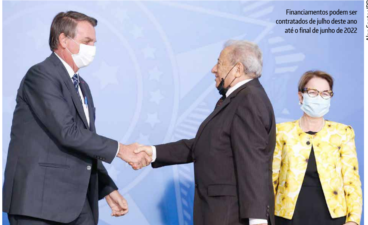
Financiamentos podem ser contratados de julho deste ano até o final de junho de 2022

As taxas de juros dos financiamentos tiveram aumento médio de 10% para os pequenos e médios produtores, na comparação com os juros praticados nos financiamentos do Plano Safra anterior. No caso do Pronaf, os juros passam de 2,75% ao ano para 3% a.a., para a produção de bens alimentícios;