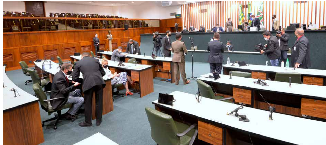
A sessão poderá ser acompanhada ao vivo pela TV Alego (canais 3.2 da TV Aberta e 8 da NET Claro), pelo Youtube e, também, no site oficial da Casa: portal.al.go.leg.br

Os processos constantes da pauta para a reunião contemplam iniciativas parlamentares e da Governadoria. Assinados por deputados são 24 projetos de lei em fase de se-