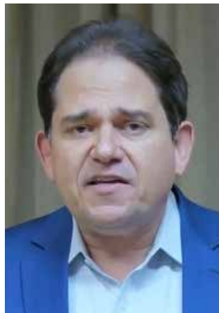
Figura emergente, que se estabeleceu durante as discussões de medidas no período de pandemia, o presidente da Fecomercio, Marcelo Baiocchi, se tornou o vice ideal de todo e qualquer candidato a governador de Goiás. Possibilidade já aberta, mas que será aprofundada somente no ano que vem.