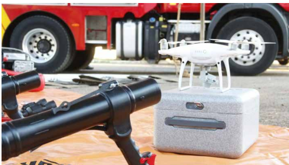
Equipamentos oferecem visão panorâmica do terreno e ajudam a acompanhar deslocamento das chamas

O trabalho na operação não é exclusivo dos bombeiros, que contam com o apoio de outras entidades. Dão suporte à iniciativa as secretarias de Estado de Segurança Pública, de Meio Ambiente e Desenvolvimento Sustentável, o Ministério Público do Estado de Goiás (MP-GO), a Federação da Agricultura e Pecuária de Goiás (Faeg), a Polícia Militar do Estado de Goiás (PM-GO), além de órgãos ambientais nos municípios.