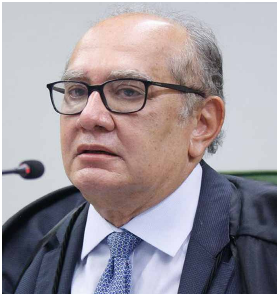
Felipe Sampaio / SCO/STF

Segundo a juíza Débora Valle de Brito, representante da Associa-