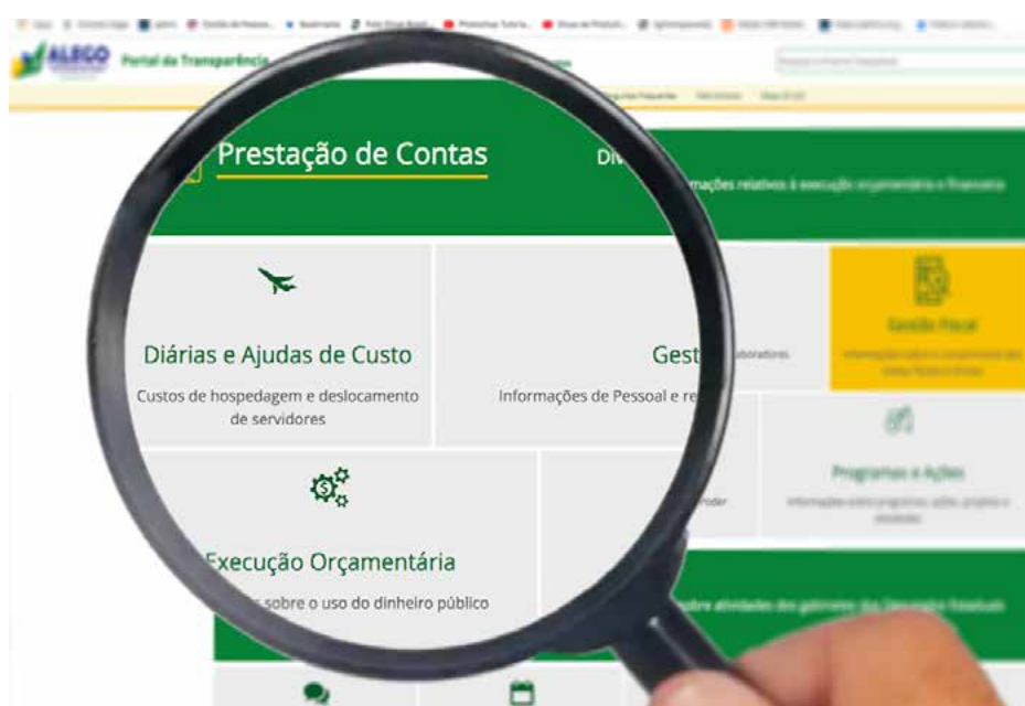
Os números evidenciam o intuito da Assembleia de cumprir, com êxito, esse que é um dos principais pilares da Administração

Relatório divulgado pela Diretoria de Tecnologia da Informação sobre os acessos ao site da Casa, durante o mês de maio de 2021, aponta o