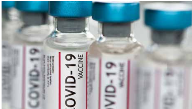
Governador Ronaldo Caiado, durante entrevista coletiva, projeta avanço da vacinação em Goiás: “Até setembro, vamos concluir vacinação da população acima de 18 anos”

ligação do ministro da Saúde, Marcelo Queiroga, para informar sobre a chegada do carregamento de vacinas da Janssen hoje, ao Brasil, no Aeroporto Internacional de Guarulhos (SP). “Ainda no decorrer da tarde, ele passará um cronograma novo, com números de doses que nós receberíamos. Não só do imunizante da Janssen, como também de outras fabricantes”, concluiu.