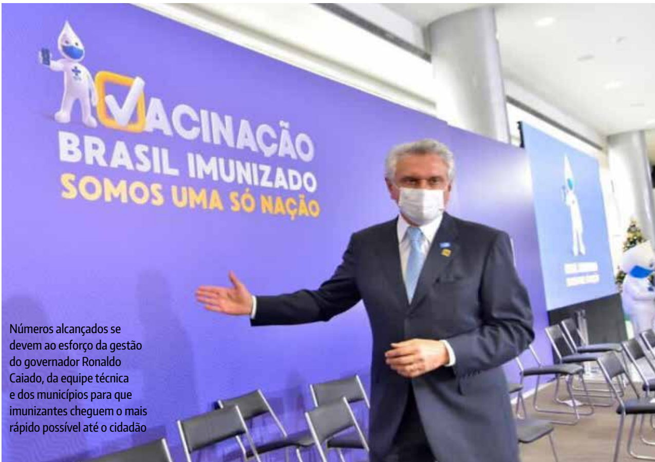
Números alcançados se devem ao esforço da gestão do governador Ronaldo Caiado, da equipe técnica e dos municípios para que imunizantes cheguem o mais rápido possível até o cidadão

Em Goiás, conforme pactuado em reuniões com gestores municipais e estaduais, o cronograma da campanha define que 70% das doses serão destinadas para a população