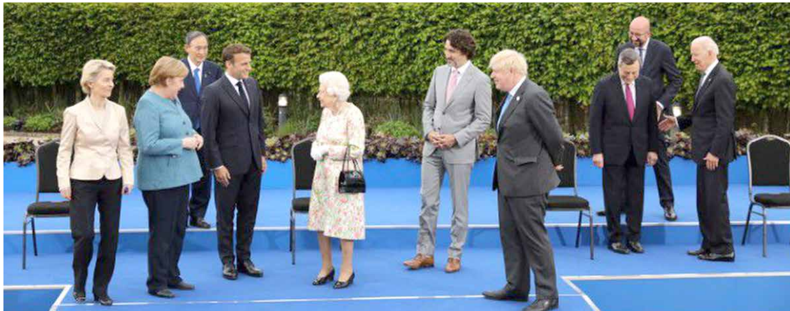
O G7 disse estar preocupado com o trabalho forçado nas cadeias de abastecimento globais, incluindo os setores agrícola, solar e de vestuário

O comunicado diz que a Rússia precisa “responsabilizar aqueles que, dentro de suas fronteiras, conduzem ataques ransomware, abusam de moedas virtuais