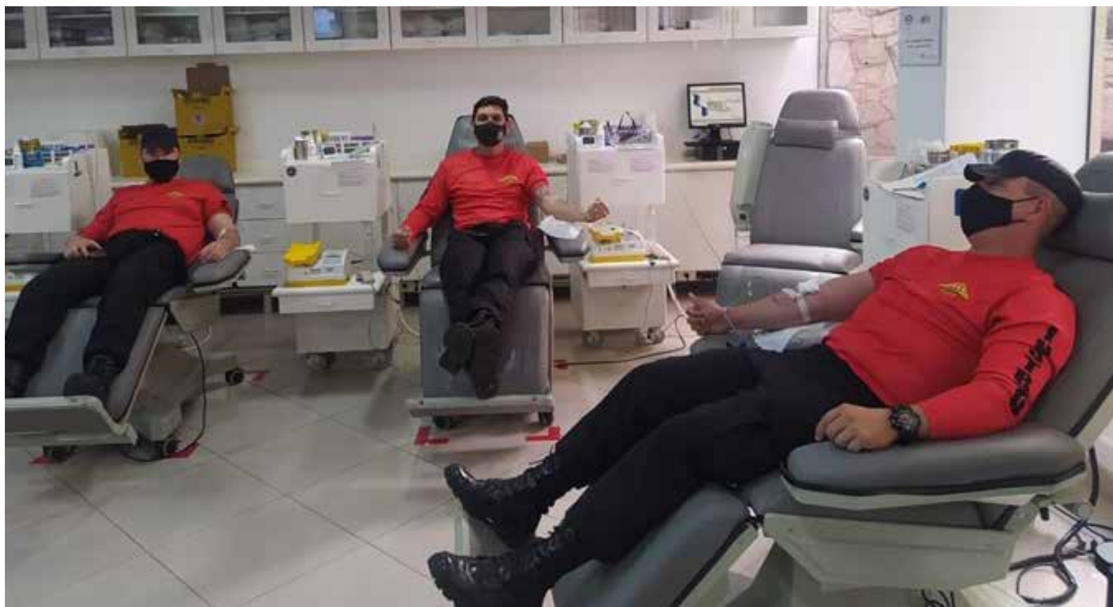
Atualmente, o Banco de Sangue do Hospital Araújo Jorge apresenta um déficit de quase 71%, em relação ao estoque mínimo para atendimento dos pacientes

Como forma de incentivar a doação de sangue entre a população, a Polícia Militar de Goiás (PMGO) iniciou, nesta sexta-feira (11/06), uma campanha para doação coletiva de sangue ao Hospital do Câncer Araújo Jorge. A iniciativa integra as ações do aniversário de 81 anos da Academia de Polícia Militar Conde dos Arcos, que ocorre também no mês de incentivo a doação de sangue,