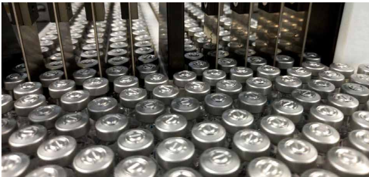
Fundação Oswaldo Cruz (Fiocruz)

Os bancos de células e vírus que chegaram à Fiocruz na semana passada garantem a produção de IFA por mais de um ano, segundo o vice-presidente da fundação. O contrato de transferência de tecnologia com a AstraZeneca prevê que outros carregamentos vão chegar para alimentar a produção por quatro anos. Essas novas remessas poderão trazer aprimoramentos da vacina que, futuramente, deverão surgir a partir de novos estudos ou mutações