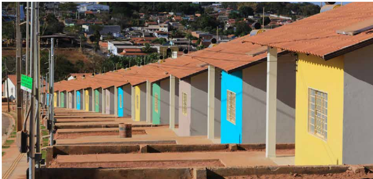
A previsão é que primeiras residências sejam entregues ainda este ano

Também será aberto novo chamamento público para credenciamento de empresas especializadas em serviços técnicos profissionais para execu-