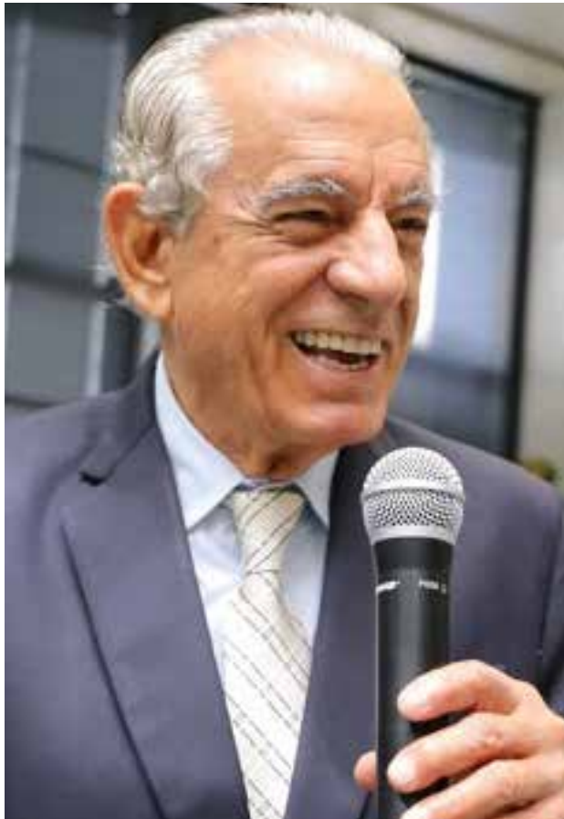
Iris Rezende é próximo de Caiado e segue trabalhando ostensivamente para levar o MDB a apoiar a reeleição em 2022