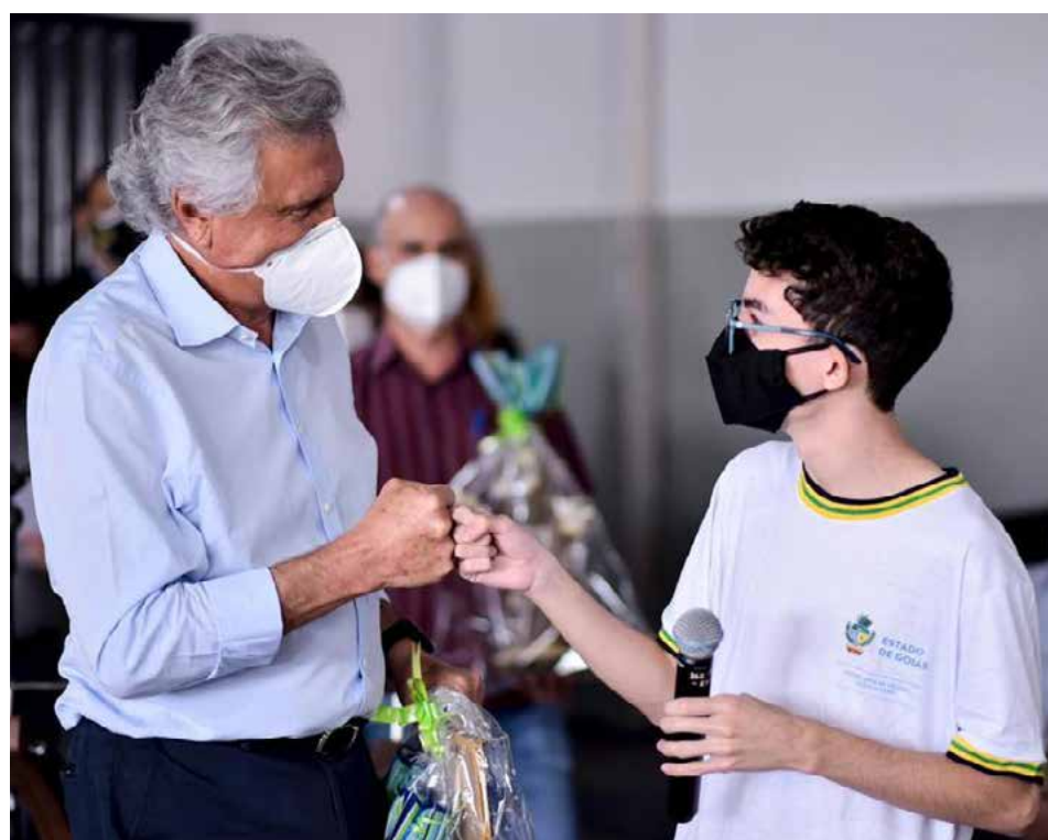
Os alunos terão mensalmente um crédito de R$ 30 para a compra de itens alimentícios

O objetivo da iniciativa é dar mais autonomia às famílias na aquisição dos alimentos. Além dos 983 alunos do colégio, todos os estudantes da rede pública estadual de ensino, incluindo os 71 mil matriculados na capital, serão contemplados.