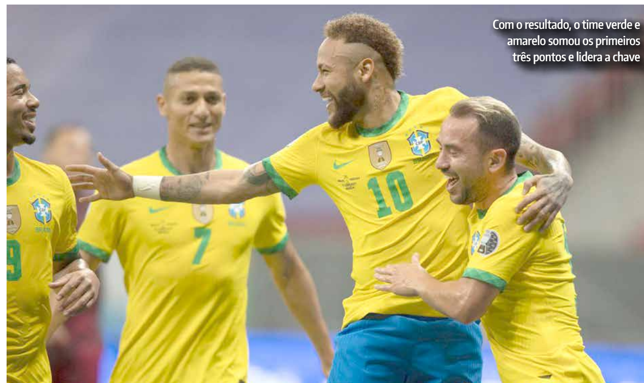
Com o resultado, o time verde e amarelo somou os primeiros três pontos e lidera a chave