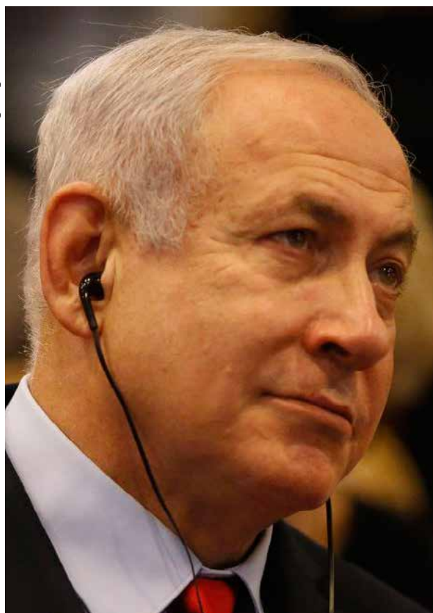
“Obrigado, Benjamin Netanyahu por seu longo serviço, cheio de realizações em nome do Estado de Israel”, disse Bennet em discurso

“Amo vocês, obrigado!”, escreveu Netanyahu em mensagem ao povo israelense no Twitter, com uma foto com a bandeira de Israel ao fundo.