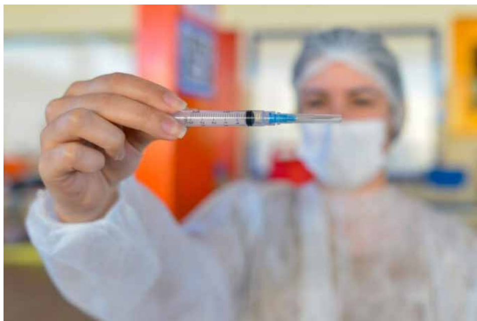
Todas as informações sobre a vacinação contra a Covid-19 podem ser verificadas no site da Prefeitura

O Banco de Sangue do Hospital do Câncer Araújo Jorge funciona de segunda à sexta, das 7 horas às 17 horas, na Rua 239, 181, Setor Leste Universitário. “Devido à situação crítica, realizamos um planejamento para a extensão do atendimento aos doadores de sangue aos sábados, das 7 horas ao meio dia. Lembrando que o Banco de Sangue está localizado dentro em um espaço próprio, que fica em frente ao hospital”. Mais informações pelo telefone (62) 3243-7031.