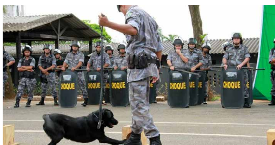
Os cães agora contam com uma enfermaria, sala de guarda de materiais de treinamento e ração

Os serviços no espaço incluíram terraplanagem e concretagem para construção do pátio. O prédio administrativo possui recepção, salas e alojamentos para o comando e subcomando, sala de aula para até 40 alunos, sala de musculação, banheiros masculino e feminino, copa e sala de estar.