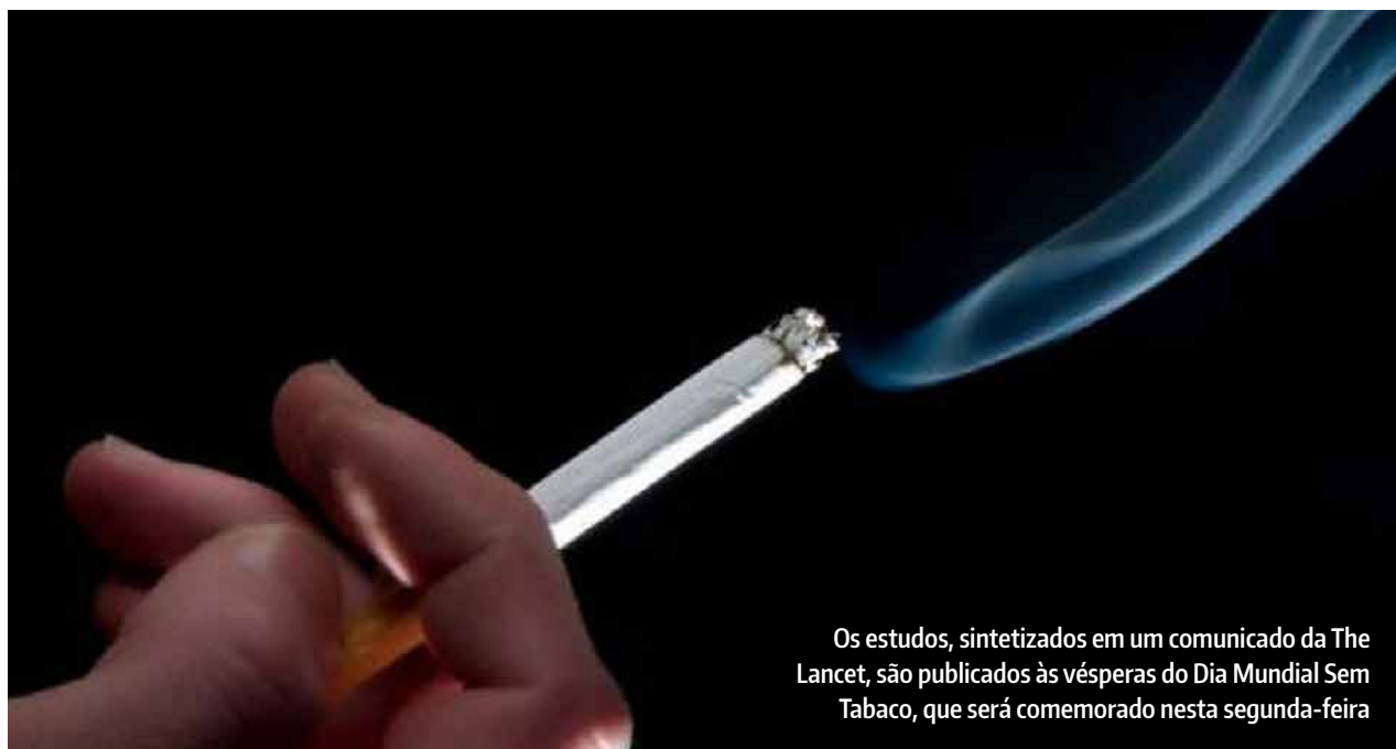
Os estudos, sintetizados em um comunicado da The Lancet, são publicados às vésperas do Dia Mundial Sem Tabaco, que será comemorado nesta segunda-feira

dos em um comunicado da The Lancet, são publicados às vésperas do Dia Mundial Sem Tabaco, que foi comemorado na segunda-feira (31).