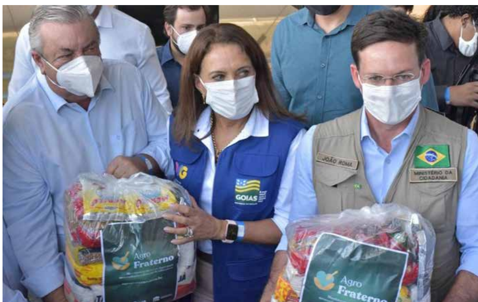
O programa já levou duas toneladas de semente para pequenos produtores em vulnerabilidade e protagonizou grandes programas de incentivo à produtividade e garantia de renda no campo, bem como segurança alimentar

“Numa soma de esforços, sem saber quem vai dar mais ou menos cestas, aqui não estamos numa competição. Nossa competição é para o bem. Podem ter certeza, o Agro Fraterno será o maior programa de distribuição de cestas básicas do Brasil, começando hoje, aqui em Luziânia”, afirmou Tereza Cristina.