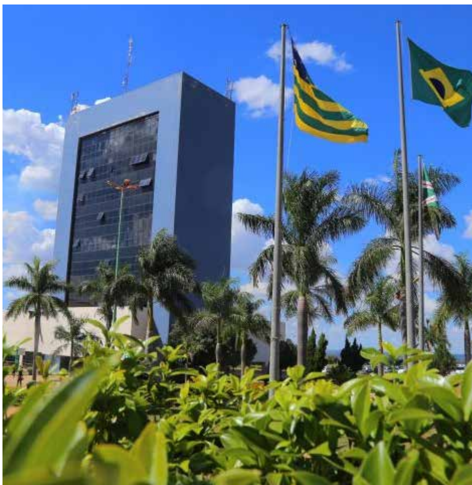
Durante o feriado prolongado, haverá alterações no funcionamento dos órgãos municipais

Os casos de urgência e emergência serão atendidos nas unidades de saúde