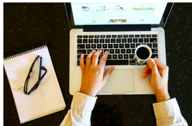
Entre as novidades da nova lei está a criação do “ambiente regulatório experimental” (sandbox regulatório), que é um regime diferenciado

Pela definição da nova lei, que entra formalmente em vigor, são consideradas startups as organizações empresariais ou societárias com atuação