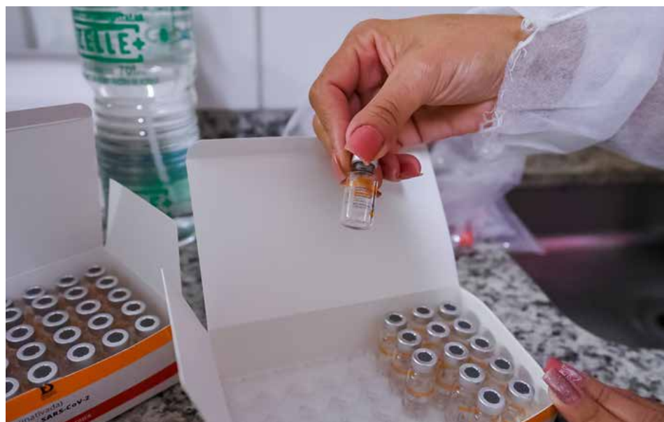
Cerca dos 70% dos imunizantes serão destinados para a população geral, iniciando com as pessoas de 59 anos

Com esse novo carregamento, Goiás atinge a marca de 3.055.920 de doses já recebidas desde o início da campanha, em janeiro deste ano. Até às 15h de terça-feira (01/06), o Estado registrou que 1.441.942 imunizantes foram usados para aplicação da primeira dose. Em relação ao reforço, foram registradas 648.827 pessoas já vacinadas. Essa atualização dos dados nos sistemas oficiais é realizada pelos municípios, que são os responsáveis pela aplicação das vacinas em seus territórios.