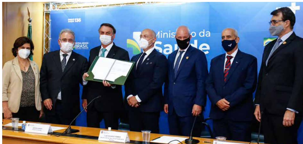
O presidente Jair Bolsonaro aproveitou a cerimônia de assinatura para falar sobre a disposição do governo federal de realizar a Copa América no Brasil

O 1º lote de doses da Oxford/AstraZeneca foi importado. Em seguida, a Fiocruz passou a fazer o envase e finalização do processo a partir do rece-