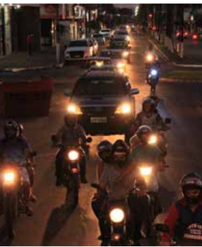
A manifestação levou em conta que, os postos de combustíveis de Iporá colocaram valores acima da média estadual

No final da tarde e começo da noite desta segunda-feira, 31, iporaenses foram às ruas para um protesto contra o preço de combustíveis praticados na cidade. Cerca de 40 veículos saíram do Lago Pôr-do-Sol em manifestação, puxados por mensagem em som volante. A manifestação de iporaenses levou em conta que, no impulso da majoração de preços, os postos de combustíveis de