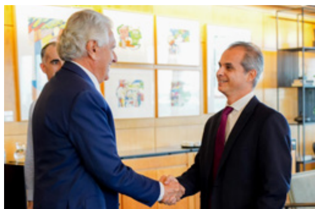
Governador Ronaldo Caiado apresenta projetos e discute parcerias com investidores do Banco Santander no Brasil

“Foi um convite para que Goiás pudesse apresentar as suas potencialidades aos clientes do banco. No cenário nacional, com nosso avanço em infraestrutura, segurança pública e melhoria da saúde no interior, os empre-