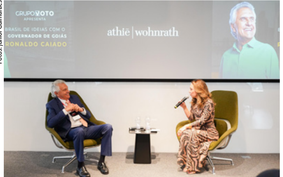
Governador Ronaldo Caiado participa de fórum de debates que reúne líderes influentes do Brasil

Desde 2004, o Brasil de Ideias busca reunir os líderes mais influentes do país e se propõe a ouvir quem faz o PIB brasileiro,