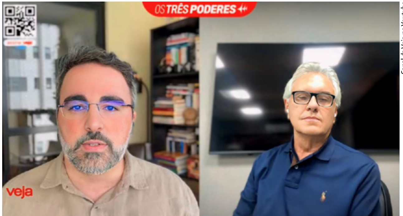
Ronaldo Caiado em entrevista ao programa Os Três Poderes, da Veja: "Cabe aos estados definir a sua política de segurança pública"

"Em Goiás a segurança é plena, dentro dos moldes que estipulamos, e temos a polícia mais eficiente do país. Por que vou mudar, se a política e o modelo que implantamos em Goiás é que deveriam ser copiados pelo governo federal?", questionou. Para o governador, a iniciativa é equivocada. "É um erro, e o governo insiste