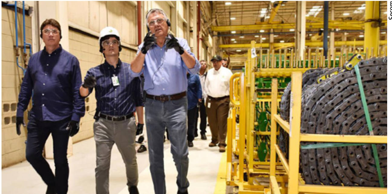
Mercado de trabalho goiano gera 57.193 empregos formais nos primeiros quatro meses de 2024 e supera números gerais de 2023

“As políticas públicas implementadas pela gestão, para capacitação e direcionamento dos goianos para melhores oportunidades de emprego têm demonstrado grande eficácia. Os dados divulgados no