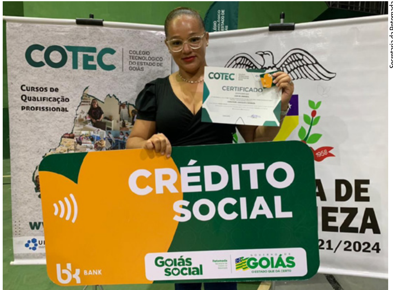
Beneficiários do Crédito Social devem preencher formulário de inscrição online para participar da seleção

“A proposta do TIM Music Goiás é investir na