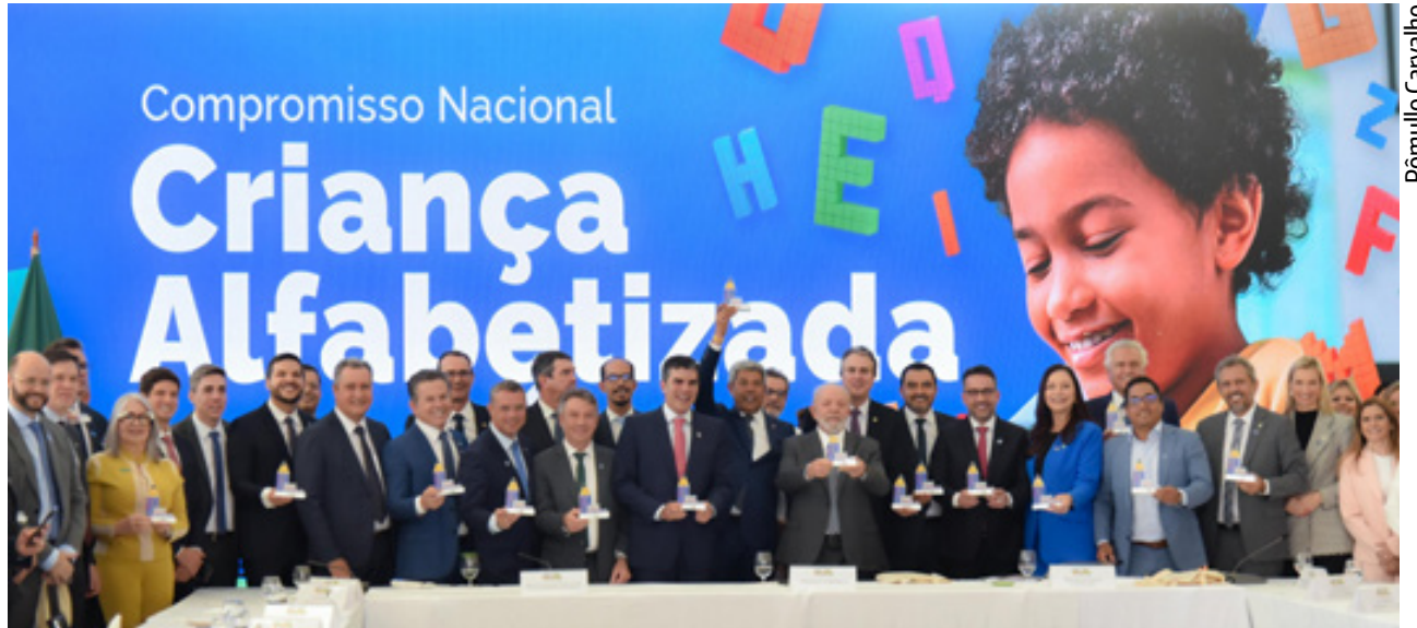
Goiás entre os primeiros no ranking de alfabetização: estado obteve avanço de 28 pontos percentuais em pesquisas realizadas nos anos de 2021 e 2023

Em Goiás, os esforços para melhoria dos níveis de alfabetização estão concentrados no programa Alfa Mais Goiás, criado em 2021, ou seja, antes mesmo do Compromisso Nacional. O programa está em execução em todos os 246 municípios goianos, com oferta de material didático, cursos de formação para professores e ativida-