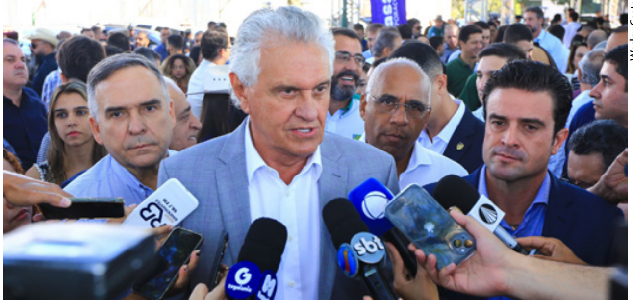
Governador chama atenção para as baixas coberturas vacinais durante coletiva de imprensa de abertura da Pecuária 2024

A Campanha de Vacinação contra a gripe, por exemplo, começou em Goiás no dia 22 de março, inicialmente para grupos prioritários. Desde o dia 2 de maio a imunização contra Influenza está disponível para toda a população acima de seis meses de idade. Mesmo assim, o índice de vacinação ainda é consi-