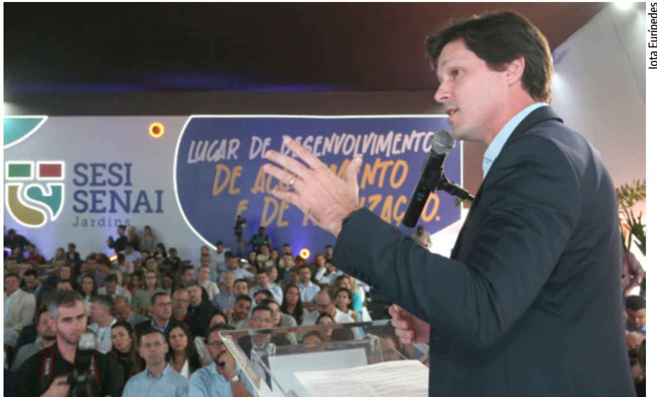
Vice-governador Daniel Vilela participa da solenidade de lançamento das obras da Escola Sesi Senai Jardins, em Goiânia