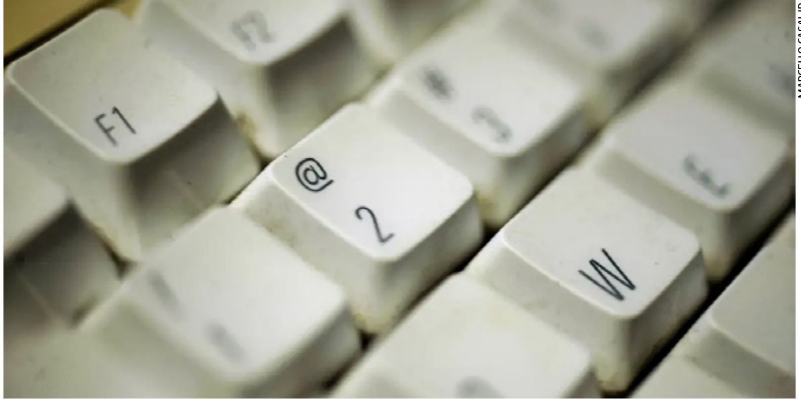
MARCELLO CASAL JR.

“Hoje, os setores financeiro, de água, de energia, de transportes e de saúde,