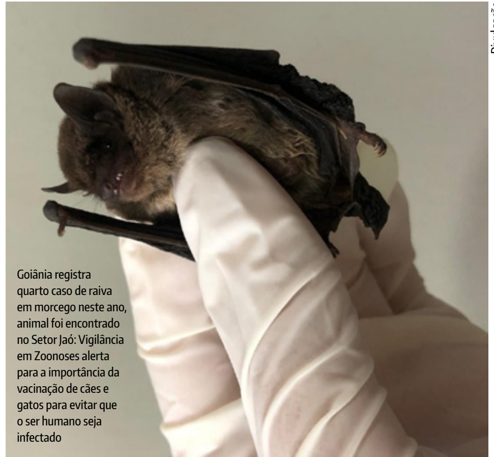
Goiânia registra quarto caso de raiva em morcego neste ano, animal foi encontrado no Setor Jaó: Vigilância em Zoonoses alerta para a importância da vacinação de cães e gatos para evitar que o ser humano seja infectado