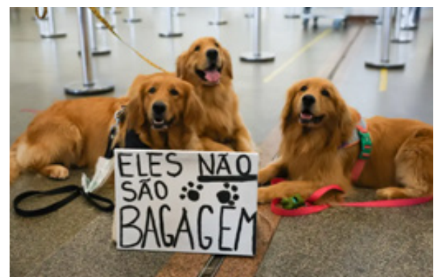
Fabio Rodrigues-Pozzebom / Agência Brasil

grande porte são colocados em uma caixa de transporte e levados em um compartimento localizado no porão da aeronave. Segundo as companhias, o local é pressurizado e não oferece risco aos animais, que não viajam junto com malas e cargas. Somente animais com até 10 quilos (kg) podem ser levados junto aos passageiros.