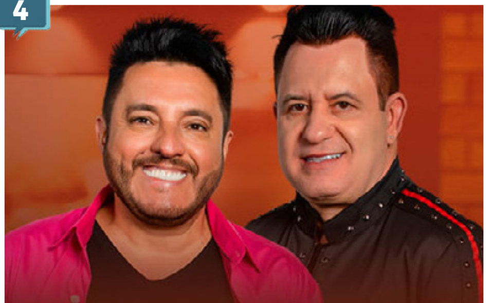
Bruno e Marrone