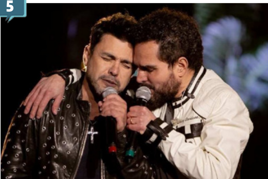
Zezé di Camargo e Luciano