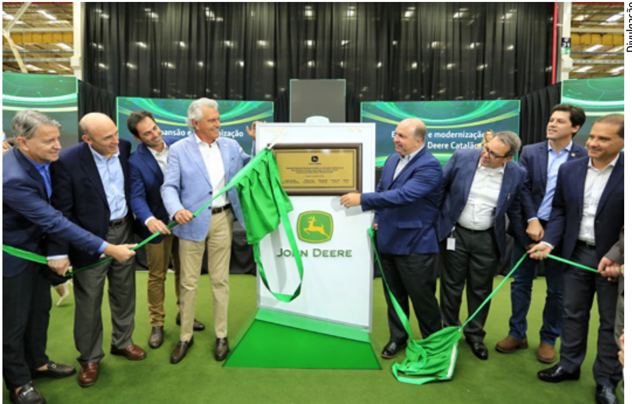
Caiado visita as multinacionais Ambev em Anápolis; Mitsubishi e John Deere em Catalão; e WeiChai/Stemac em Itumbiara: investimentos recorde

Para o governador Ronaldo Caiado, os anúncios de novos investimentos refletem o ambiente de negócios favorável ao empreendedorismo no estado. “Ampliamos a segurança, reduzimos a burocracia e estamos focados em garantir liberdade econômica para quem quer investir em Goiás. Quanto mais investimentos, mais empregos”, afirma ele, citando a máxima de que o melhor programa social é a criação de vagas de trabalho e oportunidades de renda. “Um estado competitivo, com uma economia dinâmica, proporciona melhor qualidade de vida à popu-