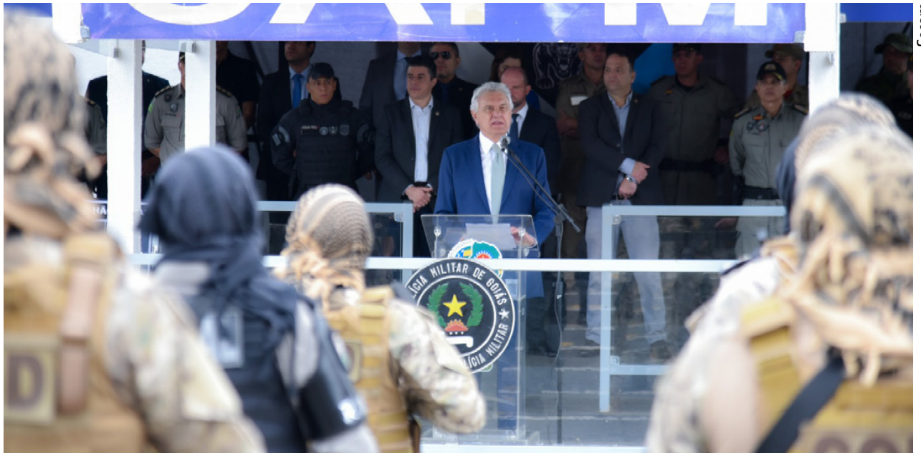
Trabalho integrado das forças de segurança resultou na queda de indicadores relacionados a feminicídios e outros crimes violentos