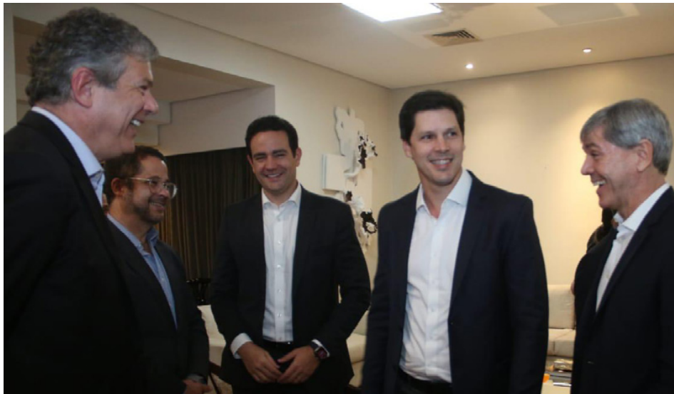
No Palácio das Esmeraldas, vice-governador Daniel Vilela deu boas-vindas a empresários do setor sucroenergético que vieram de diferentes regiões do país para conferência nacional

Em um discurso em tom incisivo, Daniel ainda explicou que um dos pilares do governo goiano é a formulação de políticas públicas que “fomentem” e “induzam” o crescimen-