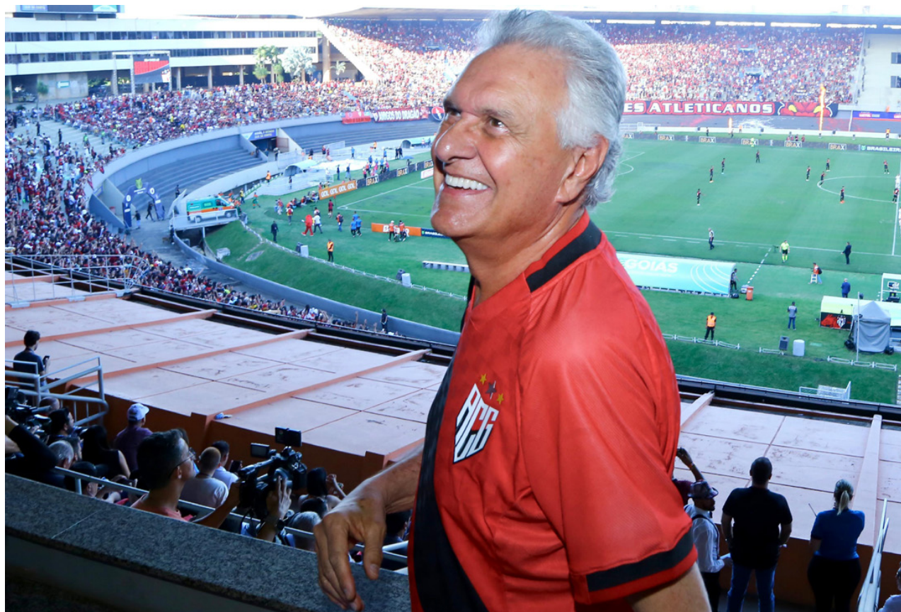
Governador Ronaldo Caiado durante jogo de abertura do Campeonato Brasileiro 2024, no Estádio Serra Dourada

Outros investimentos também foram recebidos para reforma dos banheiros e a troca do sistema de iluminação, em execução