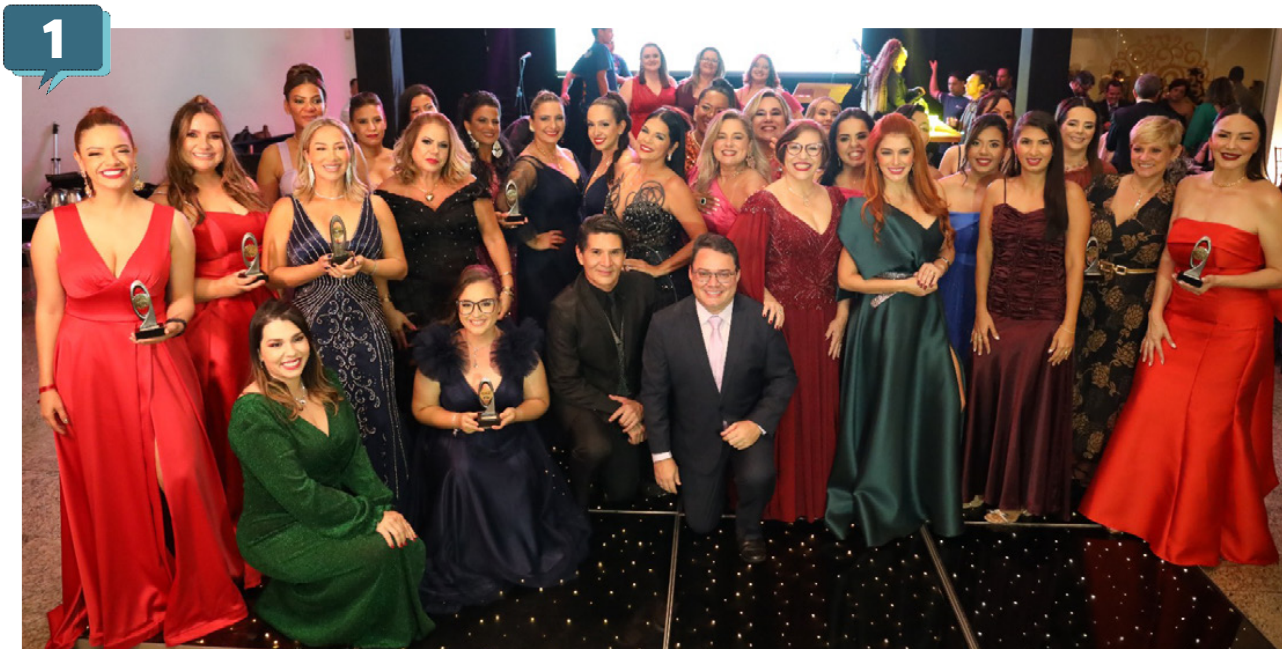
Homenageadas com o Prêmio Mulheres Empreendedoras 2024 e os idealizadores do Prêmio Jornalista Brenno Alves e Leonardo Arruda