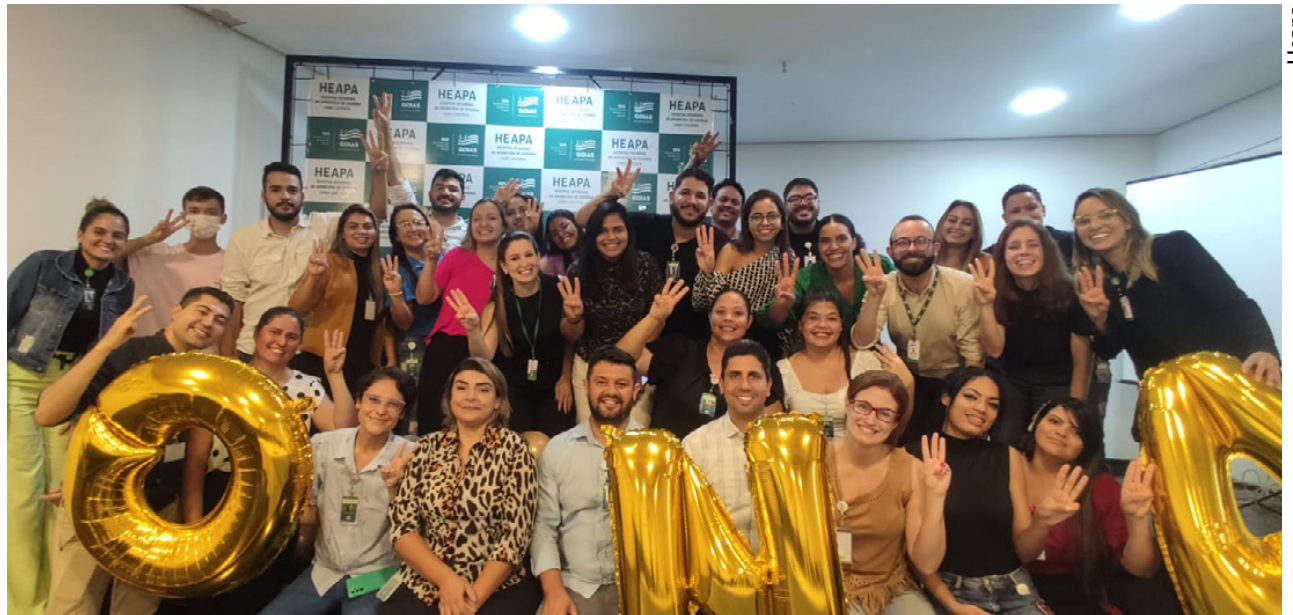
Equipe do Heapa celebra certificação de qualidade e segurança do paciente