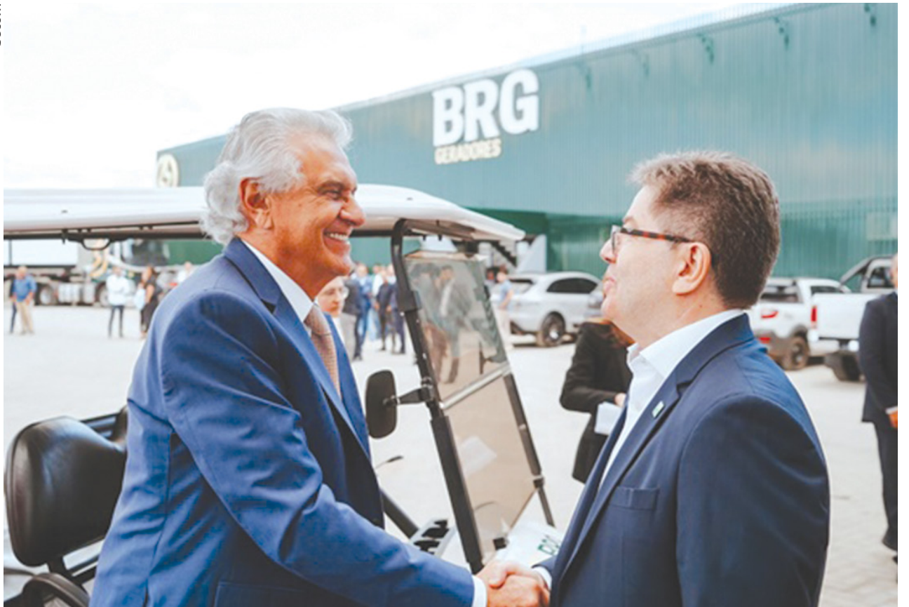
Governador Ronaldo Caiado visita empresa que anunciou investimento de R$ 40 milhões no Distrito Agroindustrial de Anápolis (Daia)

No quarto trimestre de 2023, Goiás registrou