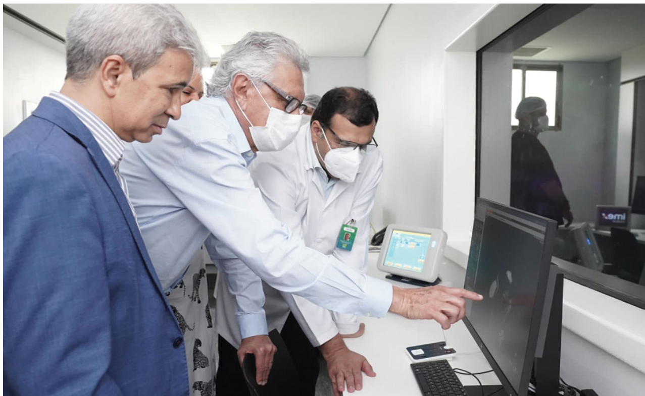
Governador Ronaldo Caiado visita HCN, em Uruaçu: “paciente tem a dignidade que merece”

Já o centro obstétrico oferece suporte durante o parto e o período perinatal, garantindo que as mães também recebam cuidados adequados. “O nosso centro obstétrico contribui para reduzir complicações durante o parto e promover um co-