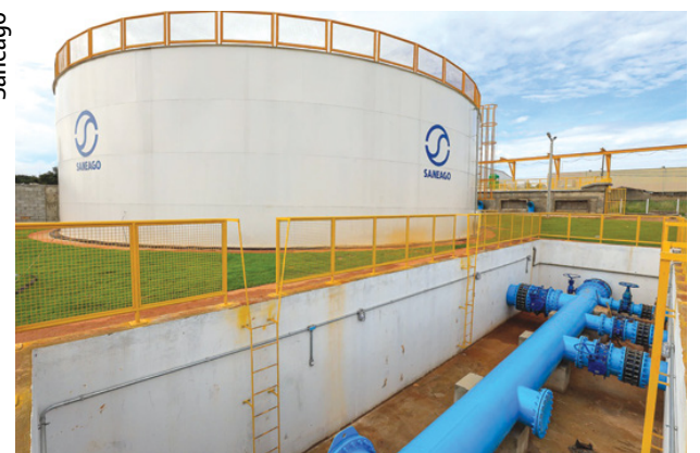
Goiânia está entre as 20 melhores cidades brasileiras em qualidade de saneamento básico

to do ano passado, recebeu do Instituto Trata Brasil o 7º Prêmio "Casos de Sucesso & ESG". Na ocasião, o município goiano foi reconhecido na categoria "Melhores Evoluções em Tratamento de Esgoto", devido ao progresso que serviço teve nos últimos anos.