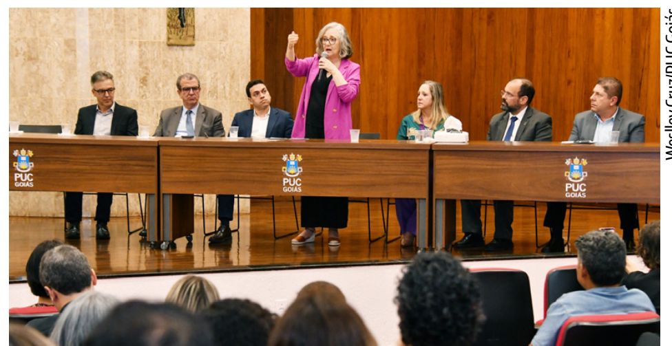
Conferência Estadual, realizada na PUC Goiás, discute sobre criação de uma estratégia nacional de ciência

"Temos grandes expectativas porque, a partir dessa discussão, teremos