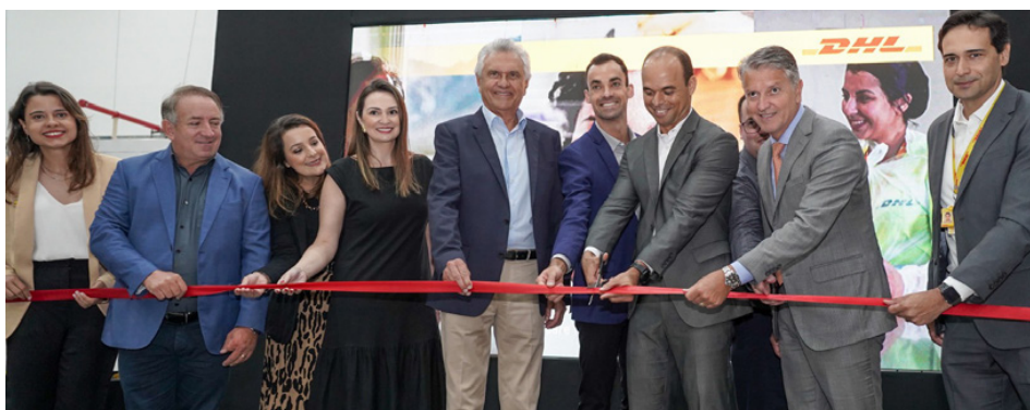
Em março de 2023, o governador Ronaldo Caiado participou da inauguração de um novo centro de distribuição da multinacional alemã DHL na cidade de Aparecida de Goiânia

rior, dezembro de 2023, o crescimento goiano foi de 5,5%. O quinto melhor resultado entre as unidades federativas com o índice divulgado. A média brasileira nesta variação foi de 3,4%. Já no paralelo entre janeiro de 2024 com o mesmo mês do ano anterior, com ajuste sazonal, Goiás obteve avanço de 1,2%, contra 0,6% da média nacional. O resultado foi quarto maior entre os todos os estados. “Goiás supera o Brasil em todas