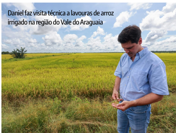
Daniel faz visita técnica a lavouras de arroz irrigado na região do Vale do Araguaia

“Este é o nosso compromisso: designar profissionais capacitados que representem o setor produtivo, a Secretaria de Estado da Agricultura e pastas afins para que formulem um diagnóstico real deste projeto e enumerem as demandas emergenciais para que, assim, possamos promover os avanços necessários”,