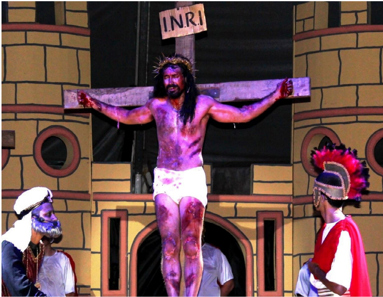
Espectáculos, oficinas e workshop estão na programação do TeNpo 2024

Dentro das ações formativas, o 19º TeNpo terá cinco oficinas voltadas às artes cênicas, cujas inscrições estão abertas até dia 26 de março. A mostra oferece ainda três workshops voltados ao empreendedorismo cultural e artístico. As inscrições podem ser feitas até o dia 29 de março pelo